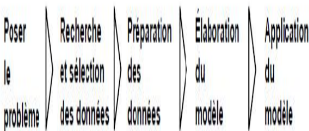
Figure 1: Processus du datamining

Application du modèle qui est, en fait, l'implantation du modèle élaboré,