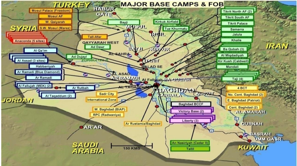
الخريطة (02): الوجود العسكري الأمريكي بموجب الاتفاقية الأمنية